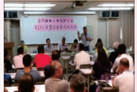
基隆分會第13屆第2次會員代表大會