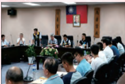
臺中分會第13屆第2次會員代表大會