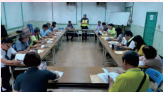
本會第14屆第26次常務理事會議