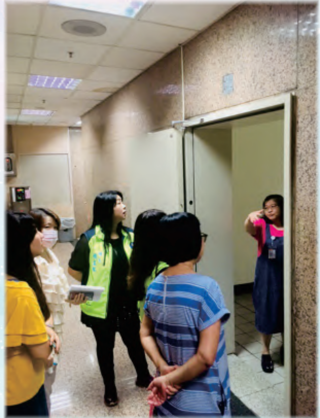
局勞資第110302案：局本部東、西二門設置刷卡鐘會勘紀實