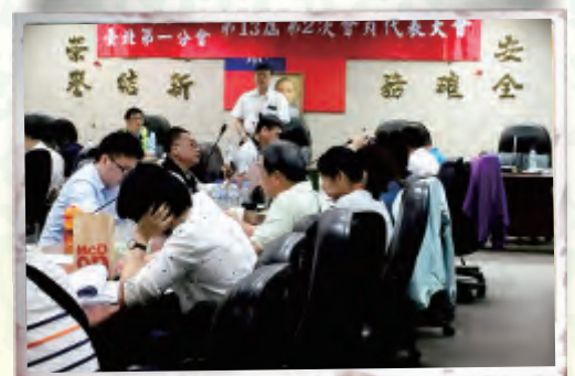
臺灣鐵路工會召開各分會第13屆第2次會員代表大會日期表