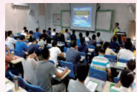
赴員訓中心運輸班講授工會業務簡介