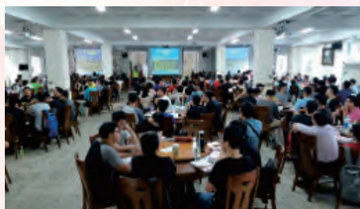
赴員訓中心新進營運人員班 講授工會業務簡介