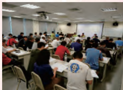
北機分會第13屆第2次會員代表大會