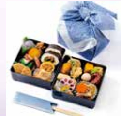
2023年6月8日推出父親節限定便當