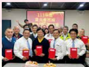
臺北第一分會致贈 退休員工紀念品