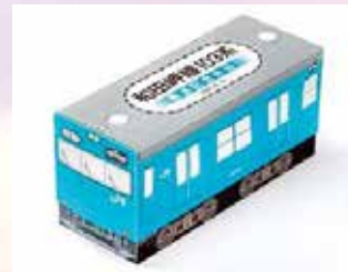
2023年3月8日推出「和田岬線103號線退休紀念便當」