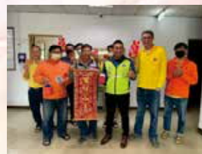
臺中分會致贈 各事業單位春節禮品