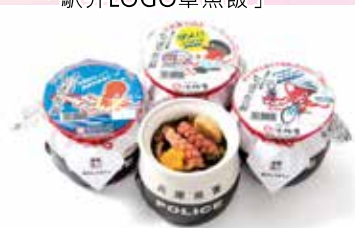
2023年9月19日配合秋季交通安全活動販售兵庫縣警察版「Hippari Dako Meshi」