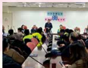
王部長國材拜訪鐵路工會