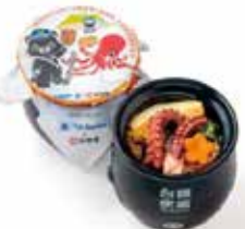
2023年12月8日與臺灣鐵路管理局締結紀念同步推出「友好協定締結紀念章魚飯」