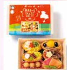
2023年7月1日與兵庫縣甲南大學和關西國際大學合作開發「Marutto兵庫護國稻荷」