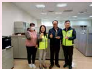
延平分會分會致贈 退休員工紀念品