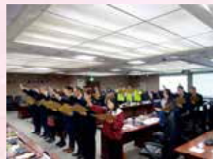
召開國營臺灣鐵路股份有限公司第1屆第1次董事會議