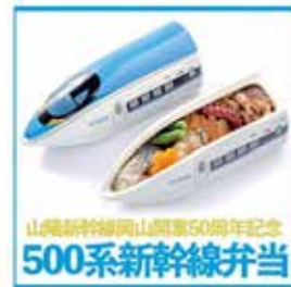
2023年3月10日推出山陽新幹線岡山開通50週年以及新神戶站開通50週年紀念的車站便當