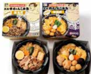
2023年9月5日推出由日本相撲協會監修「原創相撲便當」