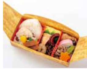
2023年7月21日慶祝JR蘆屋車站更新竣工、開幕110週年！推出「六甲山穿越便當」