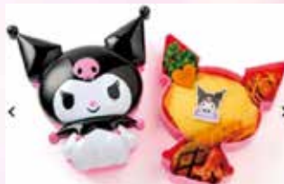
2023年12月13日推出Z世代族群中最具人氣的「庫洛米造型特色便當」