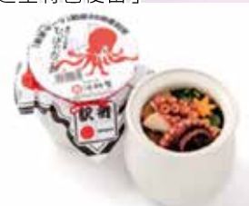
2023年11月22日配合好夫婦日・並適逢駅弁35周年推出「駅弁LOGO章魚飯」