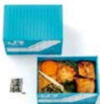
2024年1月6日推出日本JR貨物股份有限公司180型貨櫃造型「京都雞肉飯便當」