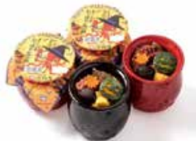
2023年10月19日配合萬聖節推出「Hippari Dako Meshi」