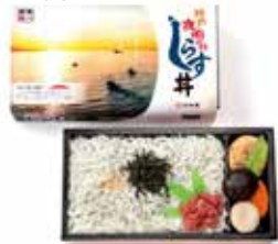
2023年8月29日與神戶市水產協會共同開發「神戶夜明白蓋飯」