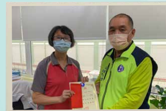
屏東分會致贈獎學金