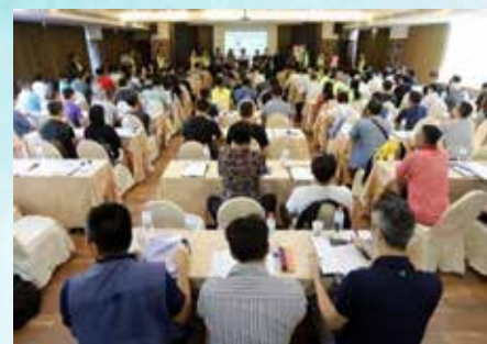
辦理各分會第14屆 理、監事研習班