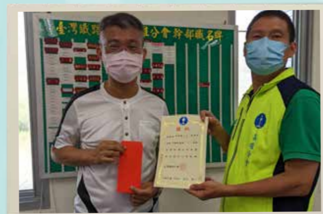
高雄分會致贈獎學金