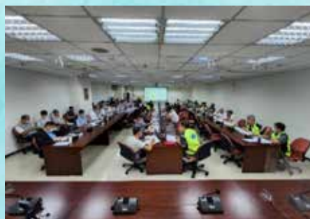
臺鐵公司化16項子協調會議