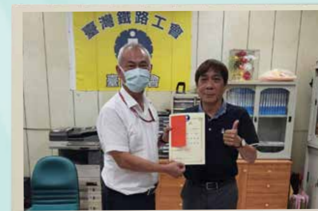
臺南分會致贈獎學金