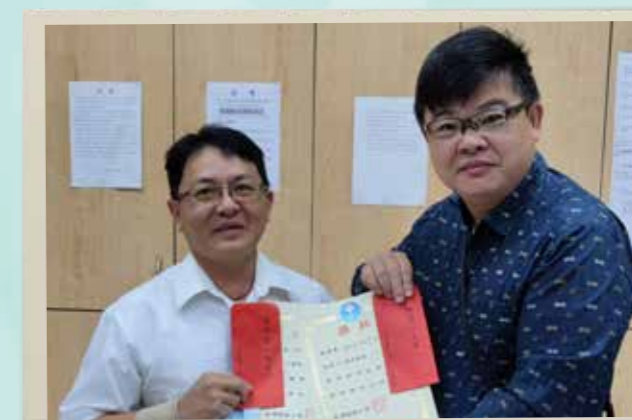
彰化分會致贈獎學金