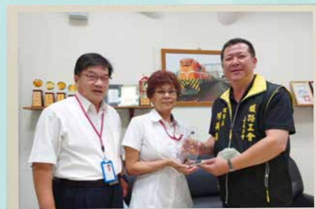
嘉義分會致贈退休會員紀念品