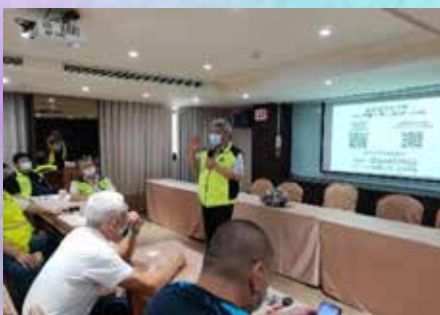
各分會辦理 「第14屆分會代表研習班」