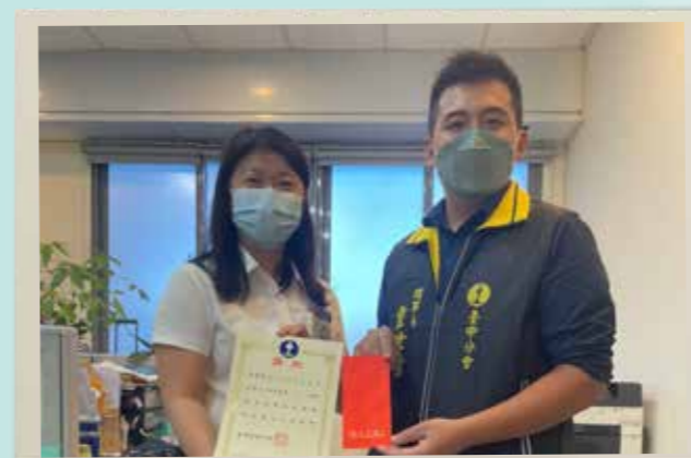
臺中分會致贈獎學金