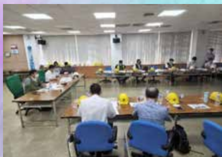
部長視察臺鐵安全改革 (花蓮機務段)