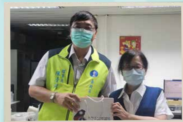
北一分會致贈退休會員紀念品