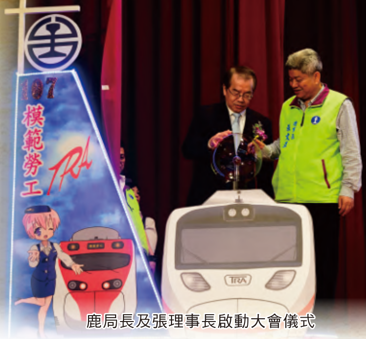
鹿局長及張理事長啟動大會儀式