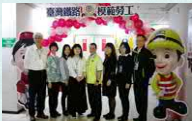
延平分會表揚所屬模範勞工