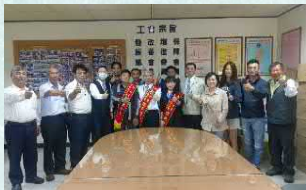
新竹分會表揚所屬模範勞工