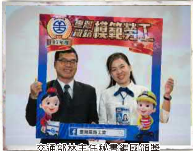
交通部林主任秘書繼國頒獎