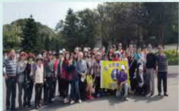
新竹員眷「宜蘭之旅」旅遊活動