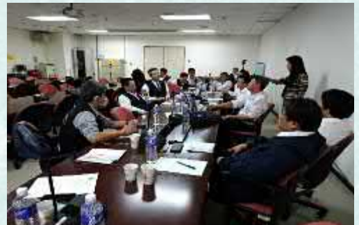
機班工時條款協商預備會議