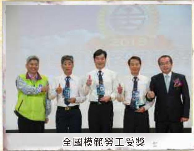
全國模範勞工受獎