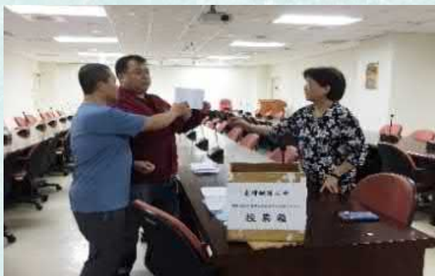
延平分會補選貨所勞資會議勞方代表