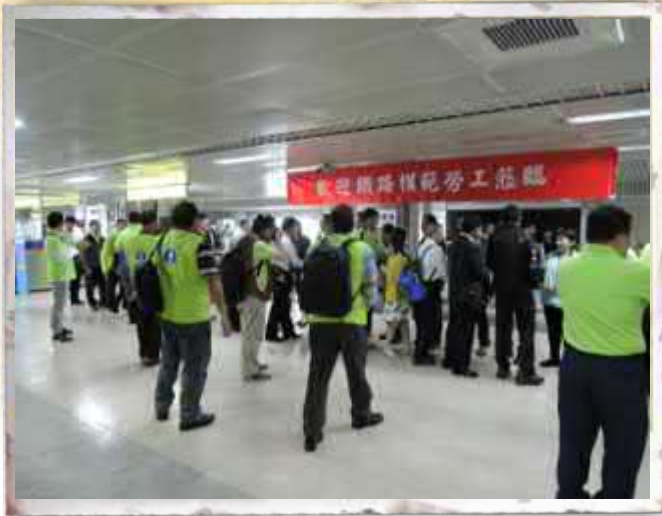
路局一級單位主管迎接模範勞工