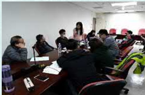
運務107年車班組工時協商 第1次預備會議