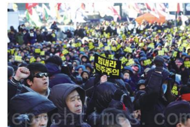
12月28日，韓國10萬人當天在首爾廣場舉行集會，抗議政府試圖推動的鐵路民營化改革。

韓國勞工運動長期累積不小的能量，在此次反民營化抗爭中，我們再次看到其強大的動員能力，除了內部員工長期教育下快速的動員力道，再加上結合外部人民的廣大聲援力量，罷工為期22天，造成運輸上重大影響，讓原本強勢的政府也不得不放下身段，正視勞工所重視的問題，最終成立鐵路產業發展小組委員會，並同意在重整過程中會重視員工意見，這樣的強大凝聚力，正是臺灣勞工運動所缺少並應仿效的。